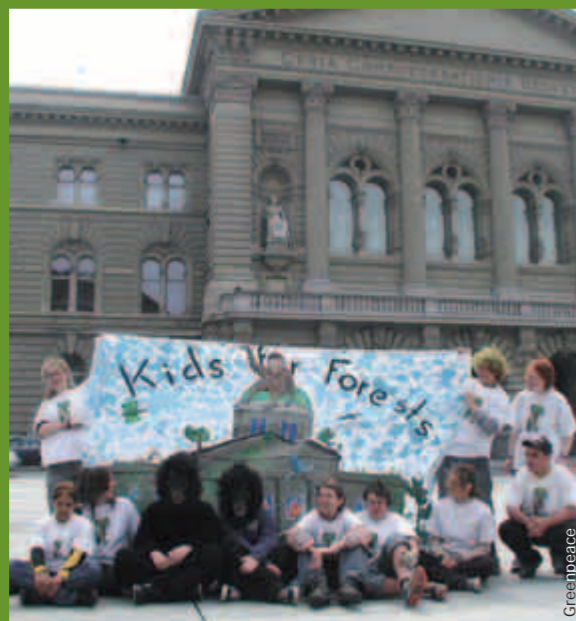
unten: Die Kids for Forest nach Ihrer VeloToUrwald.