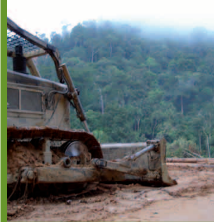
links: Strassenbau für die Ausbeutung des Regenwaldes in Sarawak. oben: Holzfällerstrasse in Sarawak.