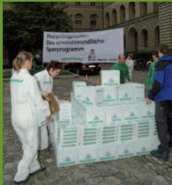
oben: Aktion vor dem Bundeshaus (Herbst 2003): Eine Tagesration Papier von 700'000 Blatt wird der Bundesverwaltung übergeben.