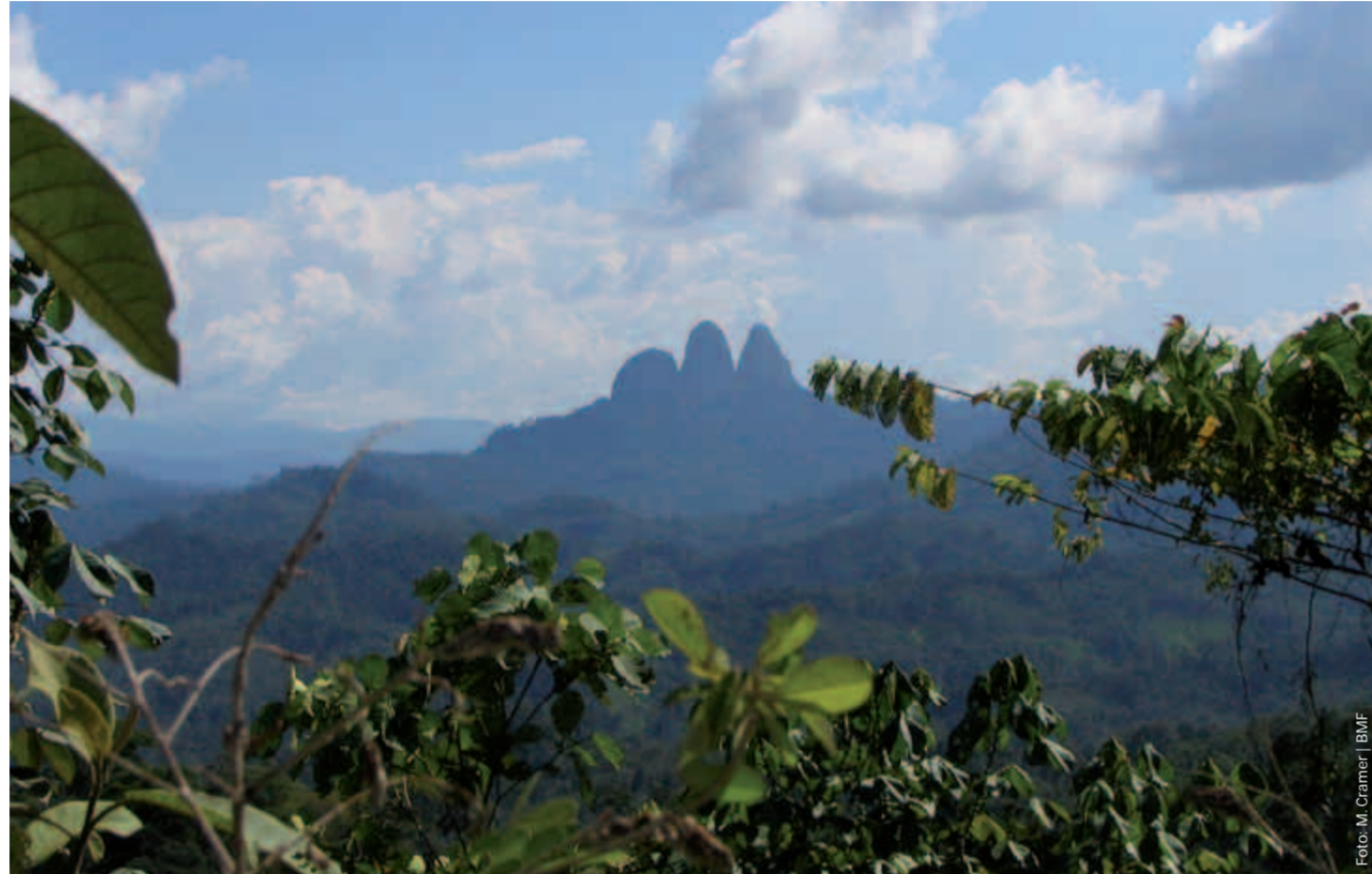
Intakter Regenwald auf Borneo: Eine verantwortungsvolle Holz- und Papierbeschaffung kann helfen, ihn zu erhalten.

Die heutige Bilanz über Urwaldfreundlichkeit auf den politischen Ebenen ist durchzogen: Positiv sind die steigende Bekanntheit der Idee und mehrere gute Beispiele für konkretes Handeln. Negativ ins Gewicht fallen ein eher geringes Interesse an der Thematik und mangelnde Umsetzung. Urwaldfreundlich.ch wird sich weiterhin dafür einsetzen, dass die Schweizer Politik auf einen urwaldfreundlichen Kurs einschwenkt.